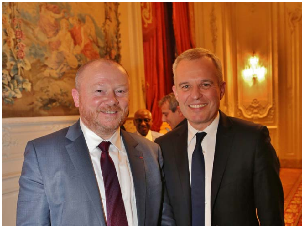
M. le Maire au côté de M. le Ministre d'Etat, Ministre de la Transition Ecologique, François de Rugy