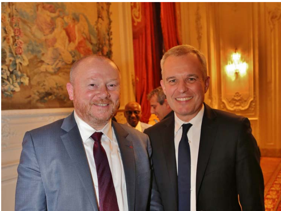
M. le Maire au côté de M. le Ministre d'Etat, Ministre de la Transition Ecologique, François de Rugy