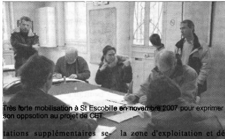
Très forte mobilisation à St Escobille en novembre 2007 pour exprimer son opposition au projet de CET

A partir de la base d'un rayon de 2 km (distance fixée par plusieurs autres industriels agro-alimentaires), 30 exploi-